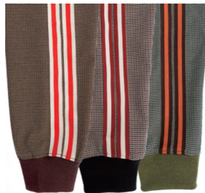
それぞれ異なる配色のニットテープライン。