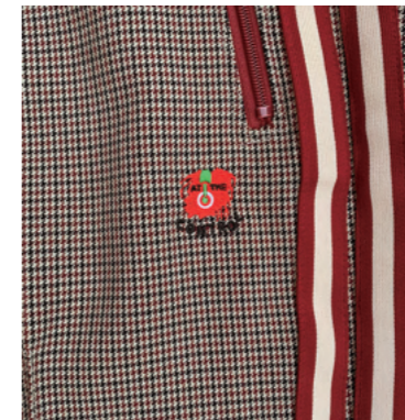
“DREAD AT THE CONTROL” 刺繍。