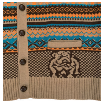
バスケットボタンとフロントポケット。