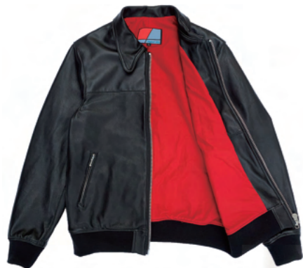
ロンジャンテイストの赤い裏地。

BEAGLE LEATHER JK と同型タイトフィッティングのデニムジャケット。ワンウォッシュ加工の INDIGO、ブリーチ加工の BLEACHED INDIGO の 2 モデル。 ※加工により下記サイズ詳細に誤差が生じる場合がございます。