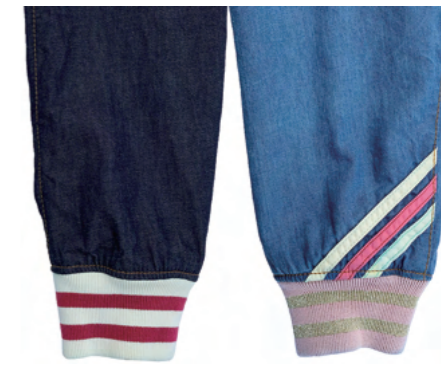
ラインデザインのリップ。BLEACHED INDIGO にはブリーチにより退色したラスタテープデザイン。