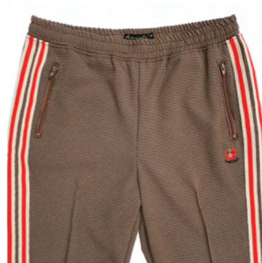
ジップポケットを配したフロントデザイン。