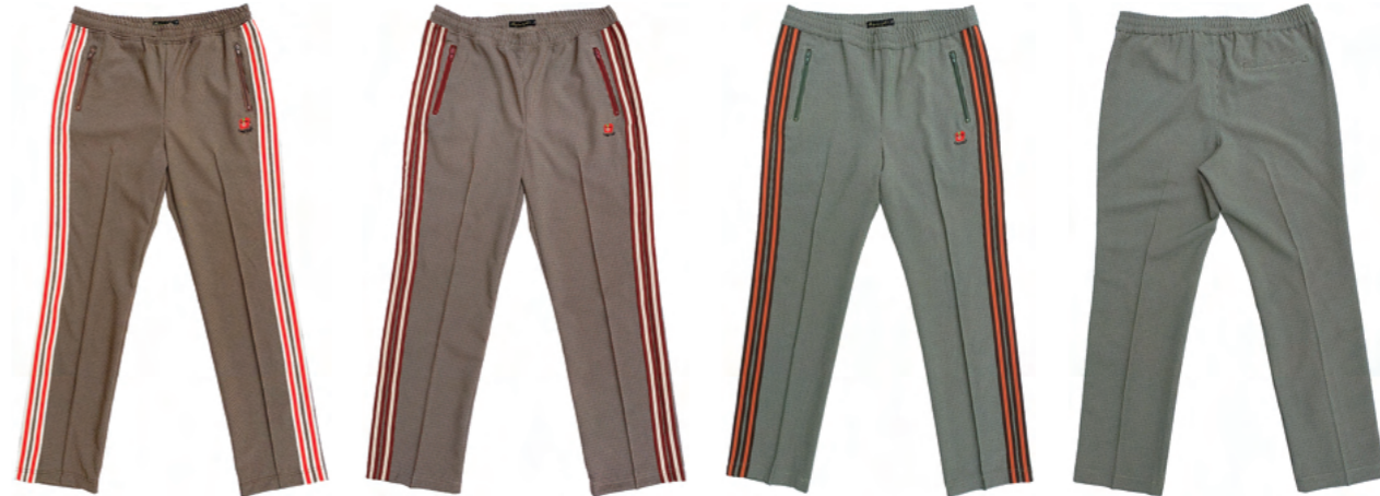
ストレッチ性の高いガンクラブチェック・ポリエステル素材を使用したトラックパンツ。 ドローコードによるウエスト調節が可能。右ヒップには玉縁ポケット。