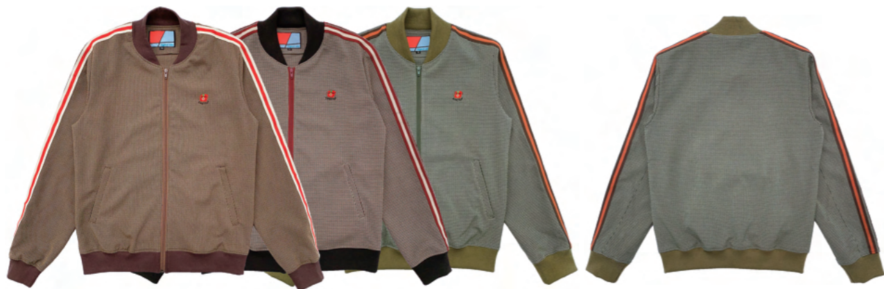
ストレッチ性の高いガンクラブチェック・ポリエステル素材を使用したトラックジャケット。 右記 PT421 とセットアップ着用が可能。