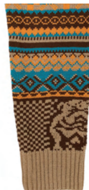
オリジナルジョンのマスコット“GREAT BRITAIN BULLDOG”