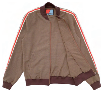
トラックジャケットらしく 裏地のないシンプルな仕様。