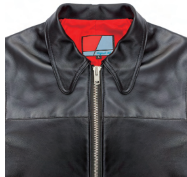
ビーグルカラー。フロントのデカジップ。