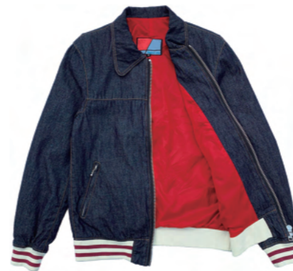
80z のライトウェイトデニム素材。ロンジャンテイストの赤い裏地。