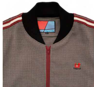
“DREAD AT THE CONTROL” 刺繍。