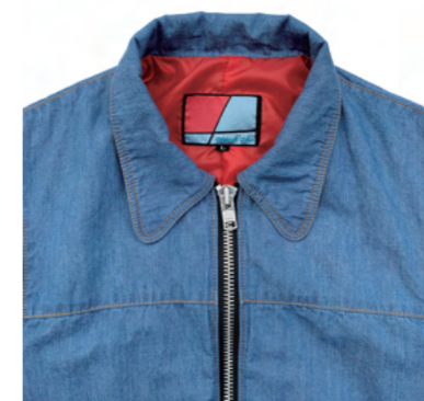
ビーグルカラー。フロントのデカジップ。