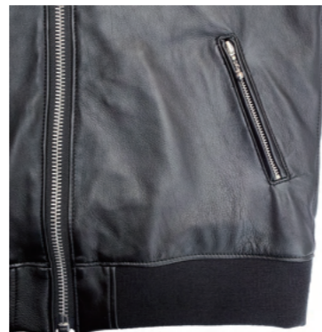
ボールチェーンのフロントポケット。