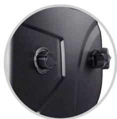
REGULADOR GRADO OSCURIDAD