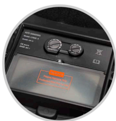
REGULADOR DE RETARDO DE OSCURO A CLARO