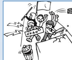
騒じょう・集団行動、 労働争議に伴う暴行