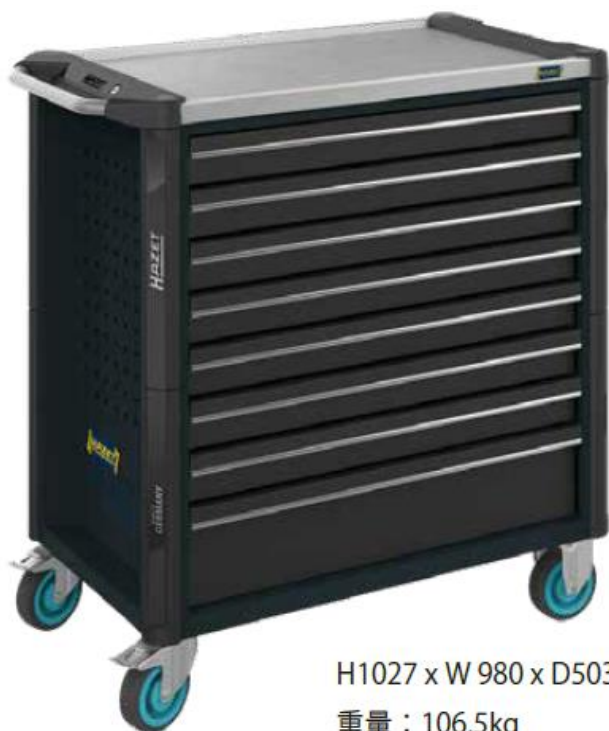
H1027 x W 980 x D503mm 重量：106.5kg