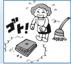
取扱上の拙劣、 又は過失