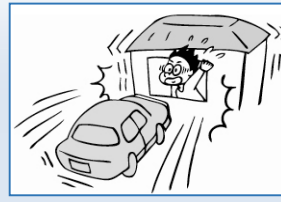
建物外部からの物体の 落下、飛来、衝突等 (航空機の墜落、車両のとびこみなど)