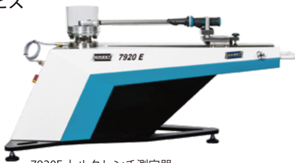
7920E トルクレンチ測定器

自社サービスラボにてトルクレンチの 修理・校正サービスを行っております。 HAZET 社の自動測定機を導入して 手動操作による測定誤差を排除しています。 又、この測定器は Net により HAZET 社に 接続されており、メンテナンスされています。