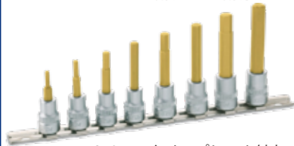
240mm クリップレール付き