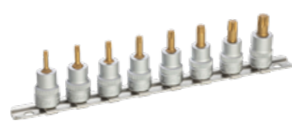
240mm クリップレール付き