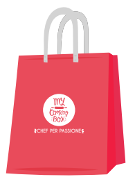
Shopper Media ( M ) cm 20 x 19.9 x h45,5