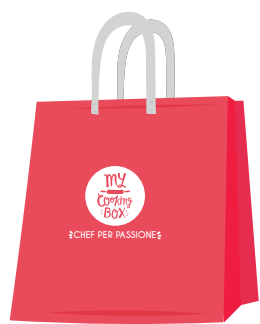
Shopper Grande ( L ) cm 40 x 25 x h40