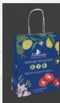
SHOPPER cod. 2599