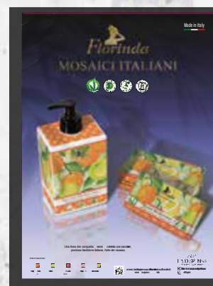
CARTELLO VETRINA - cod. 2598