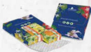
SCATOLA 2 SAPONI cod. 2597