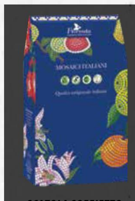
SCATOLA SOFFIETTO cod. 6015