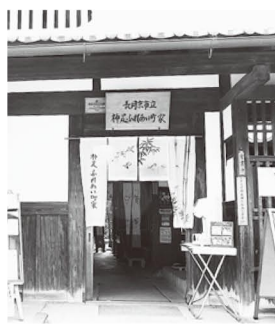
長岡京市立神足ふれあ い町家では、2月に2つ の催しを開く。各午前9 時から午後6時まで。 ▽ギャラリーMACH IYA 「クラフト宙 (そら)と仲間たち」 は2月1日から3月30日 まで開く。3、4人の作 家が、プローチなどの小 物、バッグなどを展示。 (951)5175