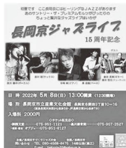
長岡京ジャズライブ 15周年記念