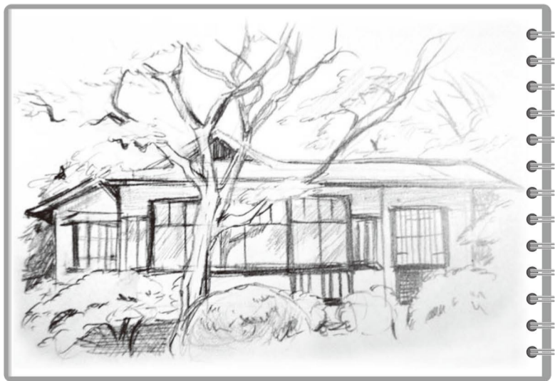
(スケッチ・井上史子さん)

京都大建築学科の草創期に教壇に立った建築家の藤井厚一(1888-1938年)が日本の気候風土、日本人の感性に合うように設計した。1928(昭和3年)に完成、いわばモデル住宅だ。本屋、閑室、茶室の3つの建物がある。2017年には、昭和の住宅としては初めて国の重要文化財になった。現在は、藤井も勤めたことがある竹中工務店が所有、聴竹居倶楽部が管理する。見学などはホームページから申し込める。