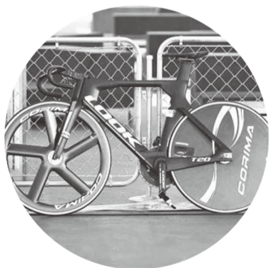
◇企画協力=株式会社JPF

「競輪」はギャンブルとしての公平性が求められ、自転車は鉄フレーム、スポーク車輪、ギア比などに厳格な基準がある。競技場も屋外の一周333～400m、路面はコンクリートなどの同一規格だ。しかし、世界は、カーボン製のフレーム、ディスクホイールになり、競技場は屋内250mの木製走路が主流だ。