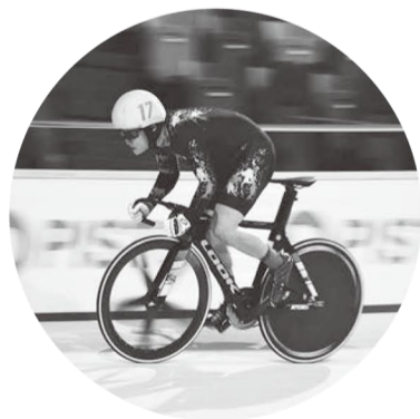
◇情報、写真提供=山岸正教さん