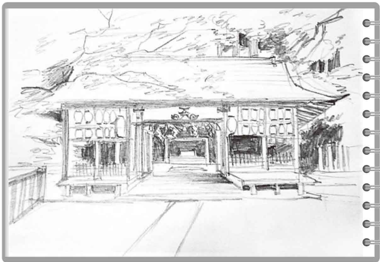
(スケッチ・井上史子さん)

天王山の麓に静かに鎮座する小倉神社は、社伝によると奈良時代の養老2年(718年)に創建された。平安時代の「延喜式」には乙訓十九座に数えられている。現在の本殿は三間社流造で、江戸時代後期の建築。石灯籠、拝殿の絵馬も江戸時代の制作という。 昔は「小倉能」が奉納された記録もある。山崎合戦に臨む秀吉は小倉神社に戦勝祈願をして、願いが叶えられた。現在では、新緑の季節ともなると、境内から天王山へ登る善男善女の姿が多い。