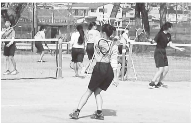
さまざまな変化にも、元気の中学生スポーツ

「乙訓中体連では、8月に3年生だけの大会を特別に実施しました。先方が大変苦労して、万全のコロナ対策を行い、保護者の方々には基本的な『無観客』を理解していただきます。選手たちの間に1日休み、という週休2日制が、クラブ活動の申し合わせになっています。生徒たちの体を休ませるといっても、心のリフレッシュも必要と思っています」 「大会日程などを、すでに3年生にとつては、残念な状況でした。競技によっては、残念な状況でした。かと思いましたが、中学スポーツは、中学生にとって、出口がなかなか見えない、コロナ禍ですが、中学生のスポーツ活動に対する思いを、 「生徒たちの『スポーツ離れ』は感じています。学校のクラブ活動によって自分自身が成長していく、という意識、目標は、中学生だと理解できています。コロナウイルスの影響で、日々の練習に何らかの制約が出てくることもあるかもしれませんが、そこは、練習のポイントを絞るとか、工夫をこらすなど、前向きに考えてほしいと思います」