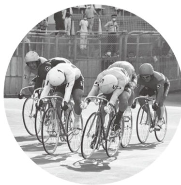
◇情報、写真提供=山岸正教さん