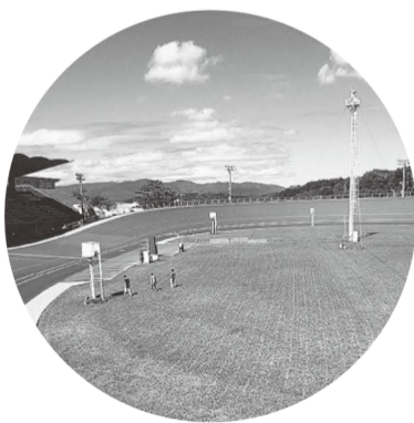
◇企画協力=株式会社JPF

今回は、競輪選手になる方法を紹介しましょう。養成所で訓練を受け、国家資格を得る必要があります。静岡県伊豆市にある「日本競輪選手養成所」の入所試験は年1回、10月ごろです。自転車競技の経験が無いプロ野球、スピードスケートなど、いろいろな競技経験者も受験します。合格者は、男子70人、女子20人程度で、約10カ月の訓練に取り組みます。