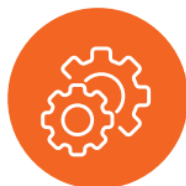
Control ajustable de acuerdo a la luz natural