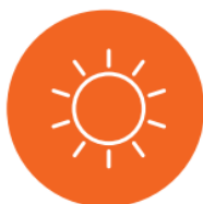
Control con sensor de luz