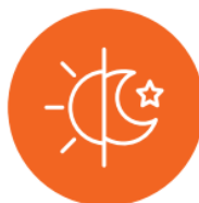
Funcionalidad de ciclo circadiano