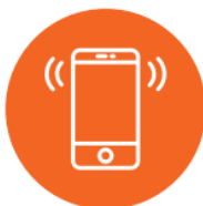
Compatible con iOS y Android