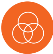
Control de colores RGB