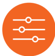
Control individual o grupal