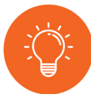
Control de blanco dinámico