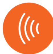
Control con sensor de presencia