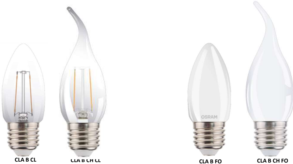
CLA B CL

Lámpara de LED Integrada Omnidireccional