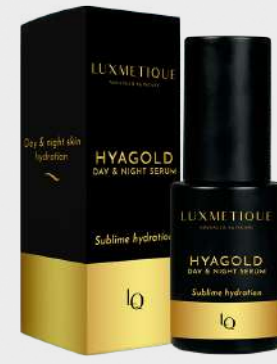
HYAGOLD DAY & NIGHT SERUM