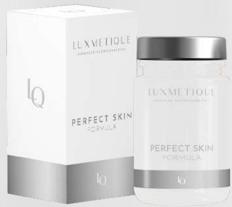
PERFECT SKIN FORMULA