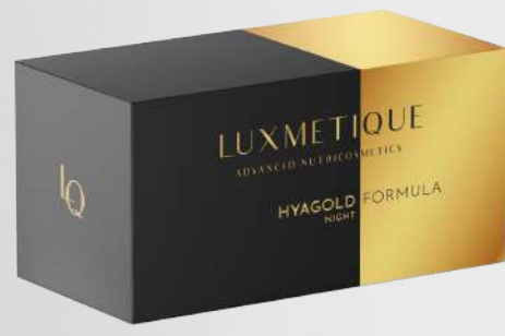
HYAGOLD NIGHT FORMULA