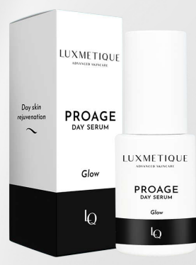
PROAGE DAY SERUM