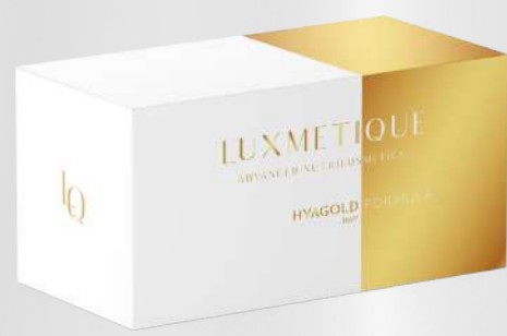
HYAGOLD DAY FORMULA