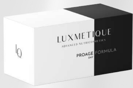
PROAGE DAY FORMULA