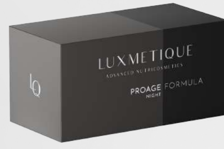
PROAGE NIGHT FORMULA