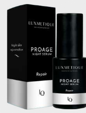
PROAGE NIGHT SERUM