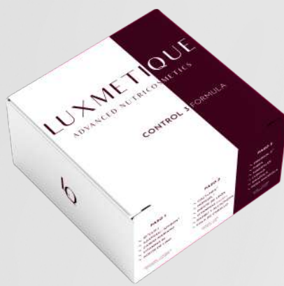
CONTROL 3 FORMULA