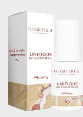
UNIFIQUE DAY & NIGHT SERUM