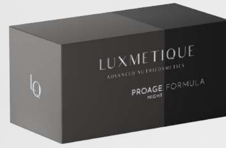
PROAGE NIGHT FORMULA