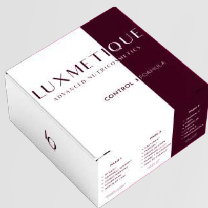
CONTROL 3 FORMULA