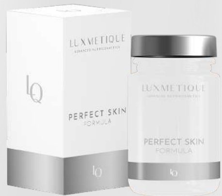
PERFECT SKIN FORMULA