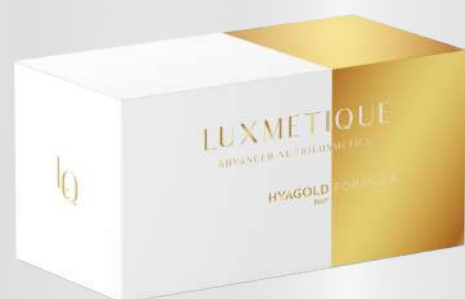
HYAGOLD DAY FORMULA