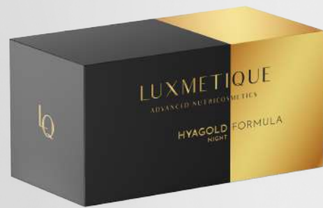
HYAGOLD NIGHT FORMULA