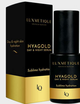
HYAGOLD DAY & NIGHT SERUM