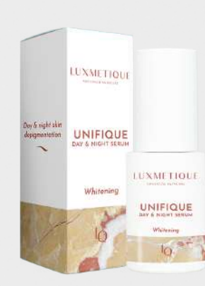
UNIFIQUE DAY & NIGHT SERUM