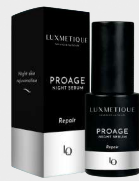
PROAGE NIGHT SERUM