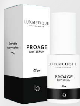
PROAGE DAY SERUM