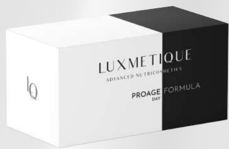
PROAGE DAY FORMULA