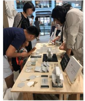
■ 「summer holiday」の取扱い商品例と、親子で楽しむ店内イメージ