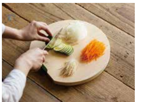
木製丸まな板 価格:中:6,380円/大:7,480円 長方形タイプに比べて奥行が広いので、 みじん切りなどもこぼれにくいのが特徴。

料理家 栗原はるみ プロデュースによる 生活雑貨ブランド 「share with Kurihara harumi」。 「こんなものがあつたらいいな」という栗原 はるみの思いを形にした生活雑貨は、和 食器や洋食器、調理器具、エプロン、布小 物など様々。機能や使い勝手のよさは もちろん、その器や調理器具があるだけで 暮らしがもっと楽しくなるように、主婦の 目線でものづくりをしています。