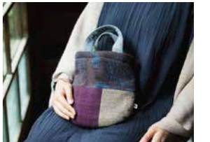
ミニ湯たんぼ 価格:5,500円

豊かな自然と懐かしい町なみが残る島根 県石見銀山より、根のある暮らしを楽し むファッションやライフスタイルの提案を 発信し続けている群言堂。会期中はウエ アをメインに取り扱う常設店の会場を広 げて、これからの季節に活躍するファブ リック雑貨などをご用意いたします。