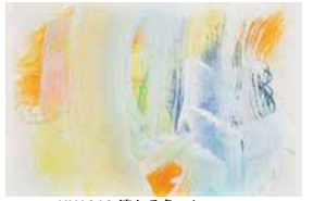
HY1218 流れる色・イエロー