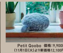
Petit Qoobo 価格:9,900円 (11月1日(火)より新価格12,100円) ユカイ工学