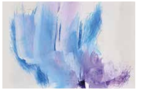
HY1219 流れる色・ドローイング11