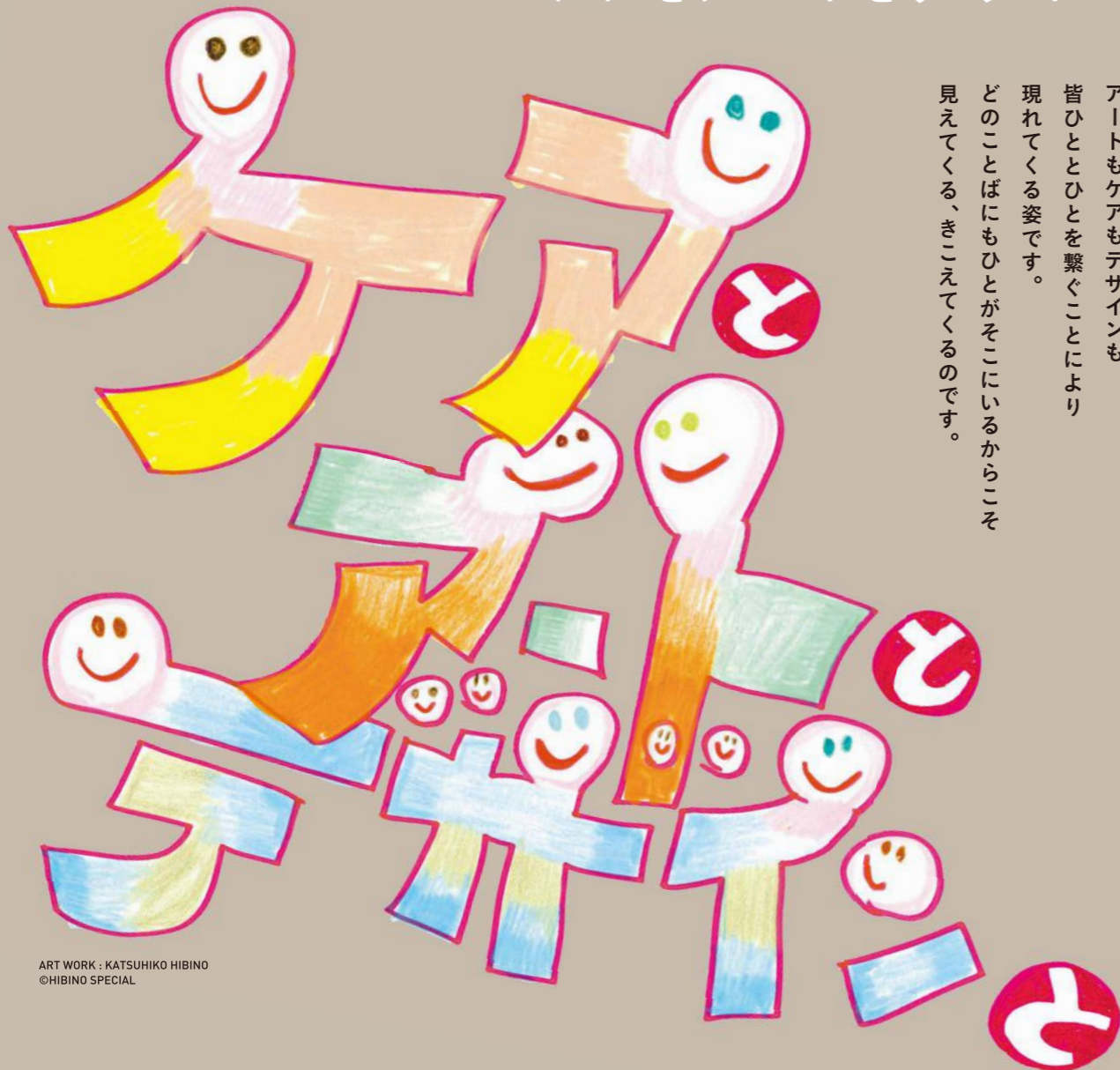
ART WORK: KATSUHIKO HIBINO ©HIBINO SPECIAL

アートもケアもデザインも 皆ひととひとを繋ぐことにより 現れてくる姿です。 どのことばにもひとがそこにいるからこそ 見えてくる、きこえてくるのです。