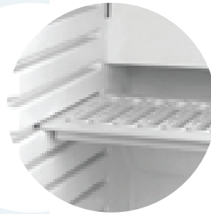
Ayarlanabilir Raflar Adjustable Shelves