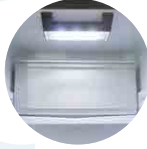
Led İç Aydınlatma Interior Led Lightning