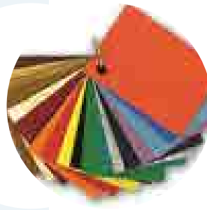
Renk Seçenekleri Optinol Colors