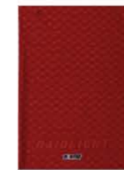
LE TOUR DE COU