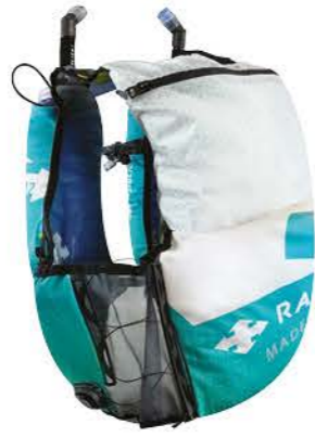
LE SAC 12L