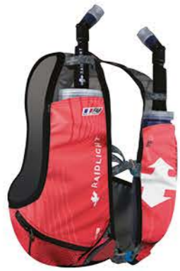
LE SAC 3L