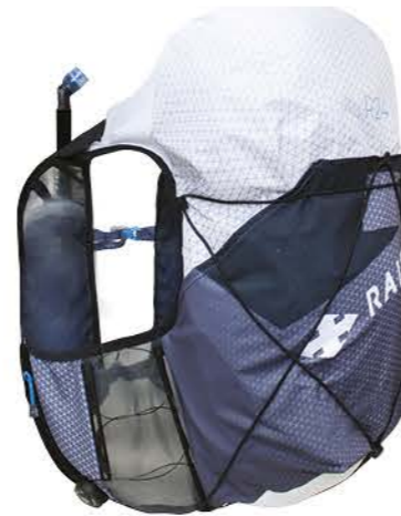
LE SAC 24L