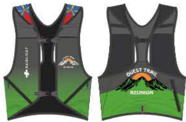
LE SAC 3L