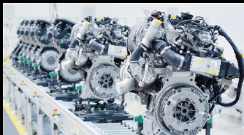
Identificazione di parti di motore durante l'assemblaggio