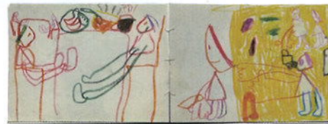
作者女儿仿画的封面以及平时的写生随笔