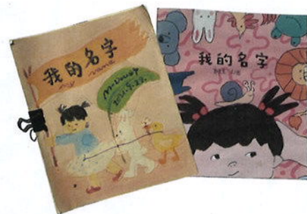
《我的名字》最初的样子及不同时期的封面