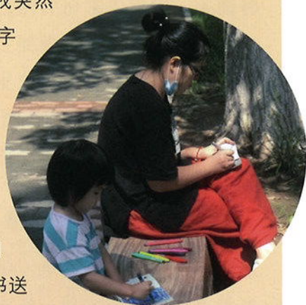
作者和女儿一起画画

反应过来，这些名字不就是很好的故事吗？于是《我的名字》诞生了。我用了一天就写好了故事，又花了大概一个月的时间画好，然后做成小书送