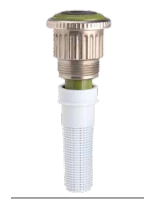
MP-HT Rosca macho