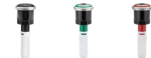
MP2000-90 de 90° a 210°