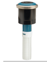
MP-CORNER Esquina de 2,5 a 4,5 m