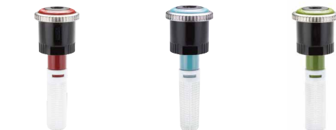
MP1000-90 De 90° a 210°