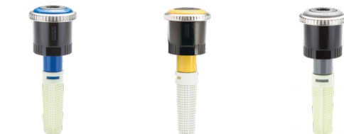
MP3000-90 De 90° a 210°