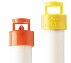
MPSTICK Encaja en cualquier longitud de PVC de 1" (25 mm) PVC para un ajuste permanente. Tubería de PVC no incluida.