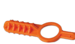
MPTOOL Se ajusta a todos los modelos de MP Rotator