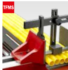
Taglio fascio meccanico Mechanical bundle clamping device