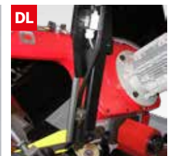
Dispositivo controllo deviazione lama Blade deflection control device