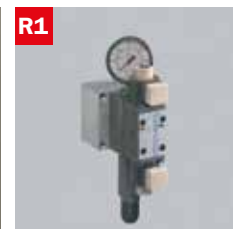
Reg. pressione morse Adjustable vice pressure