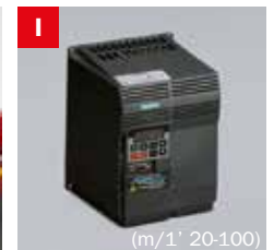
Inverter Frequency converter