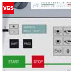
Visualizzatore gradi angolo di taglio Cutting angle display