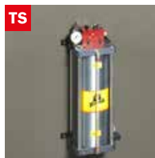
Dispositivo taglio a secco Dry cooling device