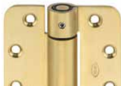
Titanium gold (IN.05.041.90.TG)