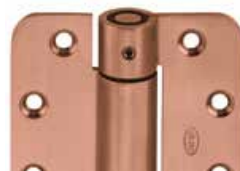
Titanium copper (IN.05.041.90.TCO)