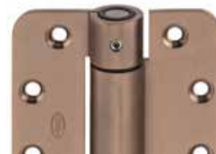
Titanium chocolate (IN.05.041.90.TCH)