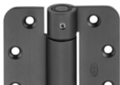
Titanium black (IN.05.041.90.TB)

Acabamentos especiais / Special finishes / Acabados especiales