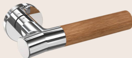
IN.00.381.C.P > OAK Polished lever handle / Puxador de porta polido