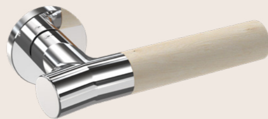
IN.00.381.BE.P > BIRCH Polished lever handle / Puxador de porta polido