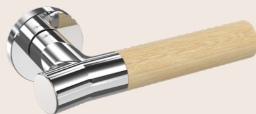
IN.00.381.BB.P > BAMBOO Polished lever handle / Puxador de porta polido