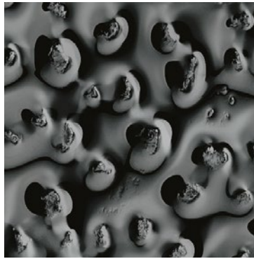
vetro fumé fuso e retroargentato Fused and back-silvered smoked glass