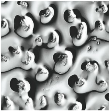
vetro fuso retroargentato back-silvered fused glass