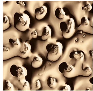
vetro bronzo fuso e retroargentato Fused and back-silvered bronze glass