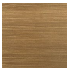
Burnished Satin Brass Ottone Satinato Brunito

Ottone satinato opaco, ottone satinato lucido o ottone brunito satinato