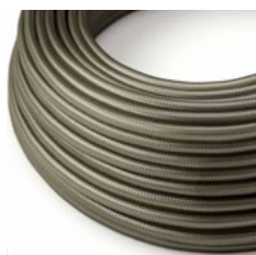
Dark Gray Grigio scuro