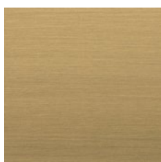
Satin Brass Ottone satinato

Canaletto, oak or mahogany wood in either an oil-treated matte or polished finish