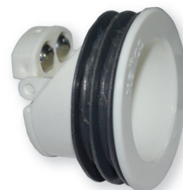
Diseño Industrial # 39155