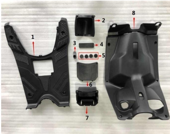
Figure J:foot skin, battery cover, etc(图J:脚踏皮、电瓶盖等)