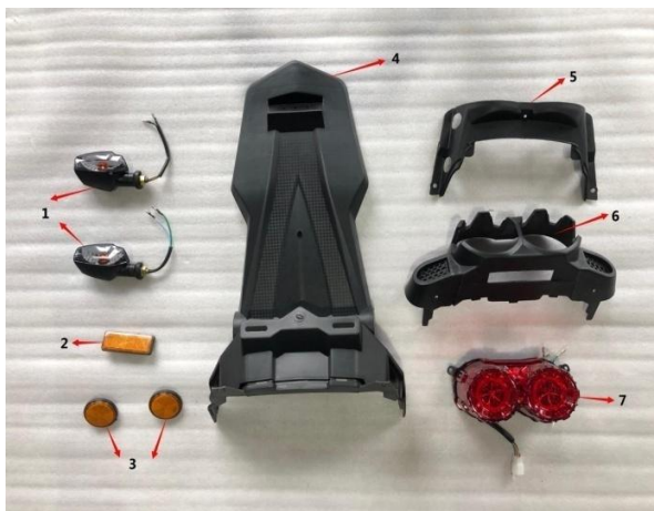
Figure D:fender,rear lamp,etc(图D:挡泥板, 后尾灯等)