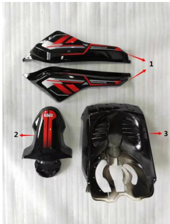
Figure G: front wall, front fender, etc (图G: 前围, 前挡泥板等)