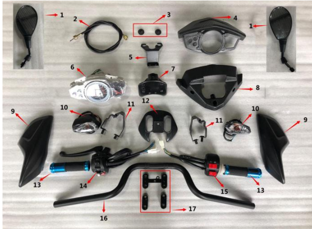
Figure E: instrument, seat direction, etc (图E:仪表、方向把座)