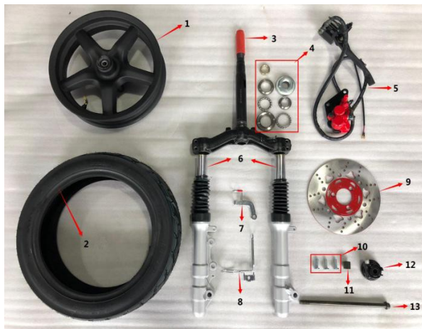
Figure C:front wheel,front shock,etc(图C:前轮、前减震等)