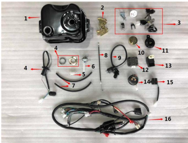
Figure: I: fuel tank, igniter, etc (图I: 油箱、点火器等)