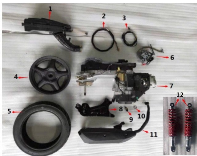
Figure B: filter, rear brake cable, etc(图B: 空滤、后刹车线等)