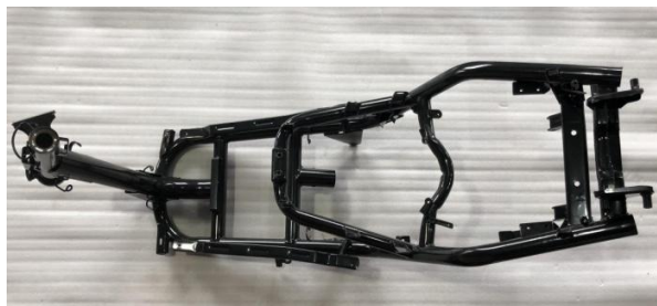
Figure A: frame(图A: 车架)