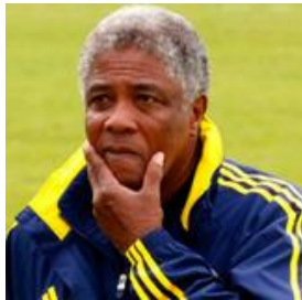
Francisco "Pacho" Maturana