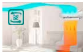
FLUJO DE AIRE 3D