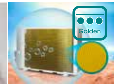
PROTECCIÓN GOLDEN FIN

El Ionizador puede eliminar eficazmente bacterias, moho, virus y polen, la concentración de ozono es inferior al límite de 0,1 mg / m 3 . El Ionizador puede mejorar la capacidad vital del ser humano, hacer que las personas se llenen de energía, mejorar la eficiencia del trabajo y mejorar la calidad del sueño.