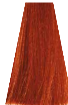
INTENSE COPPER MEDIUM BLOND biondo rame intenso blond moyen cuivré intense rubio medio cobre intenso loiro acobreado intenso