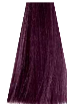
LIGHT INTENSE VIOLET BROWN castano chiaro viola intenso châtain clair violet intense castaño claro violeta intenso castanho violeta intenso