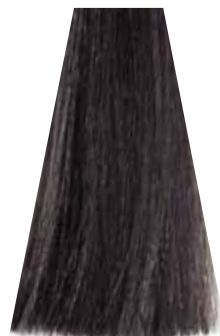
ANTRACITE antracite anthracite antracita antracite