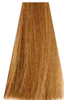
LIGHT WARM GOLDEN BLOND biondo chiaro dorato caldo blond clair doré chaud rubio claro dorado cálido loiro claro dourado intenso