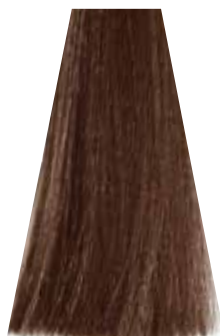
CHILLI CHOCOLATE cioccolato al peperoncino chocolat pimenté chocolate chilli chocolate chili