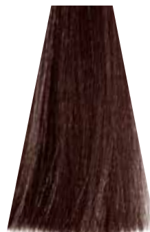
LIGHT COPPER BROWN castano chiaro rame châtain clair cuivré castaño claro cobrizo castanho claro acobreado