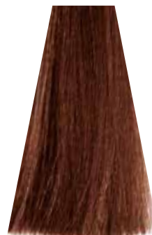
DARK COPPER GOLDEN BLOND biondo scuro rame dorato blond foncé cuivré doré rubio oscuro cobre dorado loiro escuro acobreado dourado