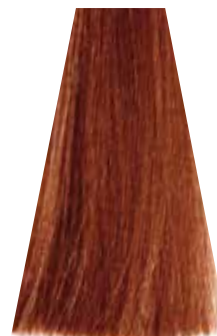
MEDIUM COPPER GOLDEN BLOND biondo rame dorato blond moyen cuivré doré rubio medio cobre dorado loiro acobreado dourado