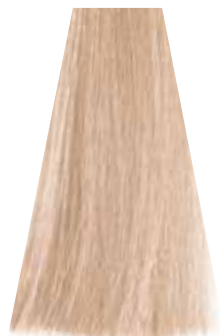
POWDER cipria poudre cipria powder