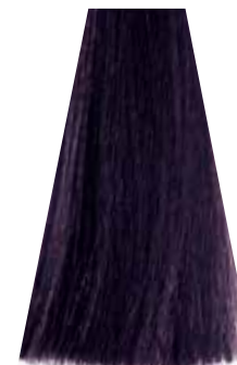
MEDIUM VIOLET BROWN castano viola châtain moyen violet castaño medio violeta castanho violeta