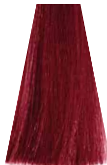
DARK RED BLOND biondo scuro rosso blond foncé rouge rubio oscuro rojizo loiro escuro avermelhado