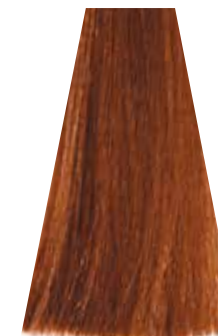
LIGHT COPPER GOLDEN BLOND biondo chiaro rame dorato blond clair cuivré doré rubio claro cobre dorado loiro claro acobreado dourado