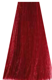
DARK INTENSE RED BLOND biondo scuro rosso intenso blond foncé rouge intense rubio oscuro rojizo intenso loiro escuro avermelhado intenso