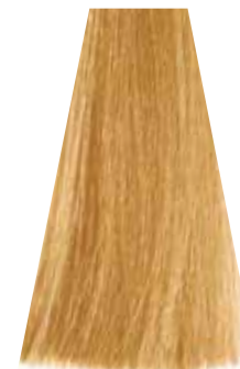
VERY LIGHT WARM GOLDEN BLOND biondo chiarissimo dorato caldo blond très clair doré chaud rubio clarísimo dorado cálido loiro clarissimo intenso