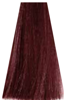
LIGHT RED BROWN castano chiaro rosso châtain clair rouge castaño claro rojizo castanho claro avermelhado