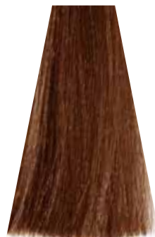
NATURAL EXOTIC LIGHT BLOND biondo chiaro naturale esotico blond clair naturel exotique rubio claro natural exótico loiro claro natural exotico