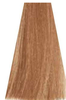
HAZELNUT nocciola noisette avellana avelã