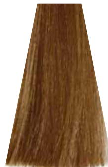
MEDIUM WARM GOLDEN BLOND biondo dorato caldo blond moyen doré chaud rubio medio dorado cálido loiro dourado intenso