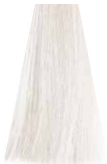
PEARL perla perle perla perola