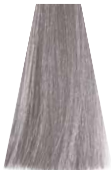
SILVER argento argent plateado prata