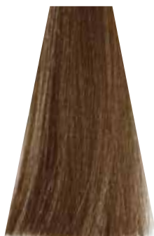
MILK CHOCOLATE cioccolato al latte chocolat au lait chocolate con leche chocolate leite