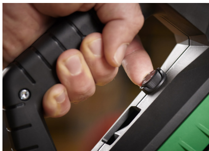
Eenvoudig te hanteren

De krachtige WELDPLAST 600 handextruder is de krachtigste extruder van Leister. Dankzij het hoge debiet is het een overtuigende keuze voor het lassen van grote tanks en containers.