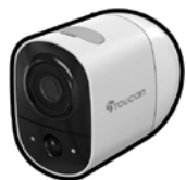
Bezprzewodowa kamera zewnętrzna