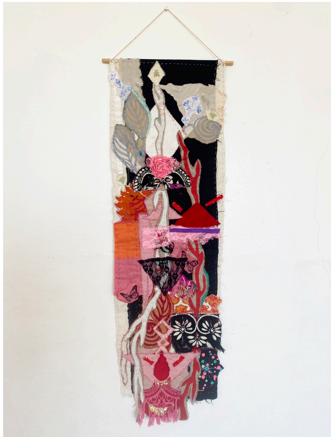
SILENCIO EN ROSA / USD$600 Medidas: 100 X 30 cm | Collage textil-telas recicladas