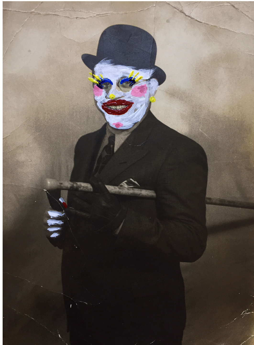
DANDI 2, SERIE DANDIS DEL PUERTO / USD$600 Medidas: 23,7 x 17,5 cm | Fotografía intervenida con pintura acrílica