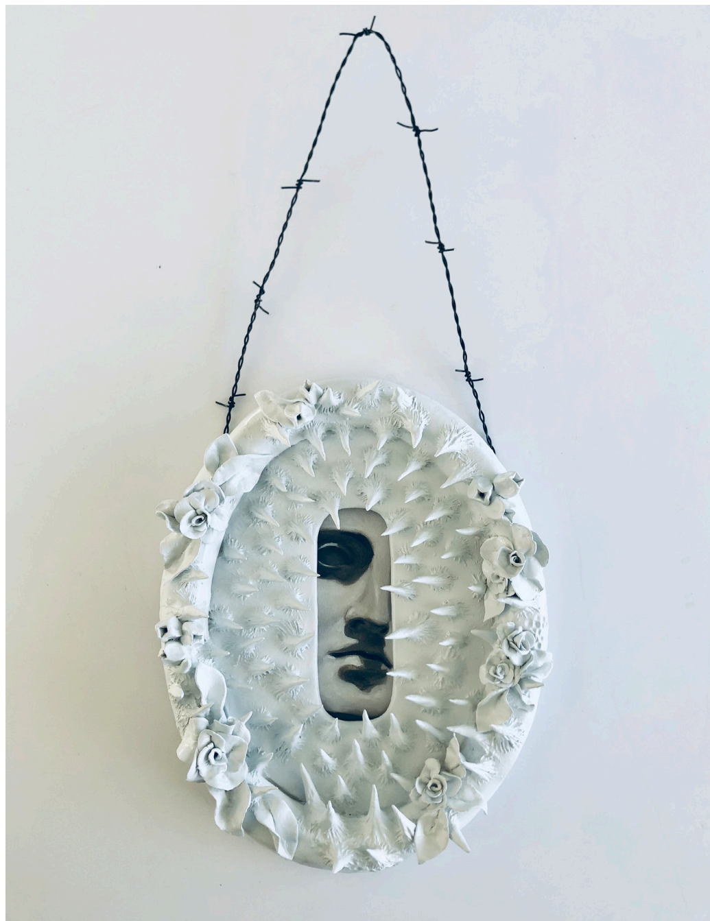
CERRADURA DENTADA / $USD600 Medidas: 60 x 25 cm | Óleo sobre tela cerámica