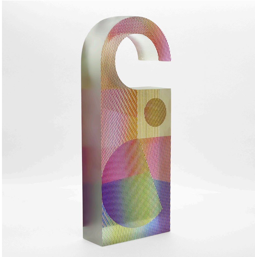
INTERSECCIONES DINAMICAS I / $USD600 Medidas: 8 x 20 cm | Acrilico impreso