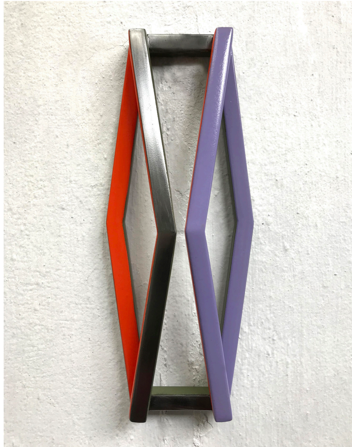
STOP / USD$600