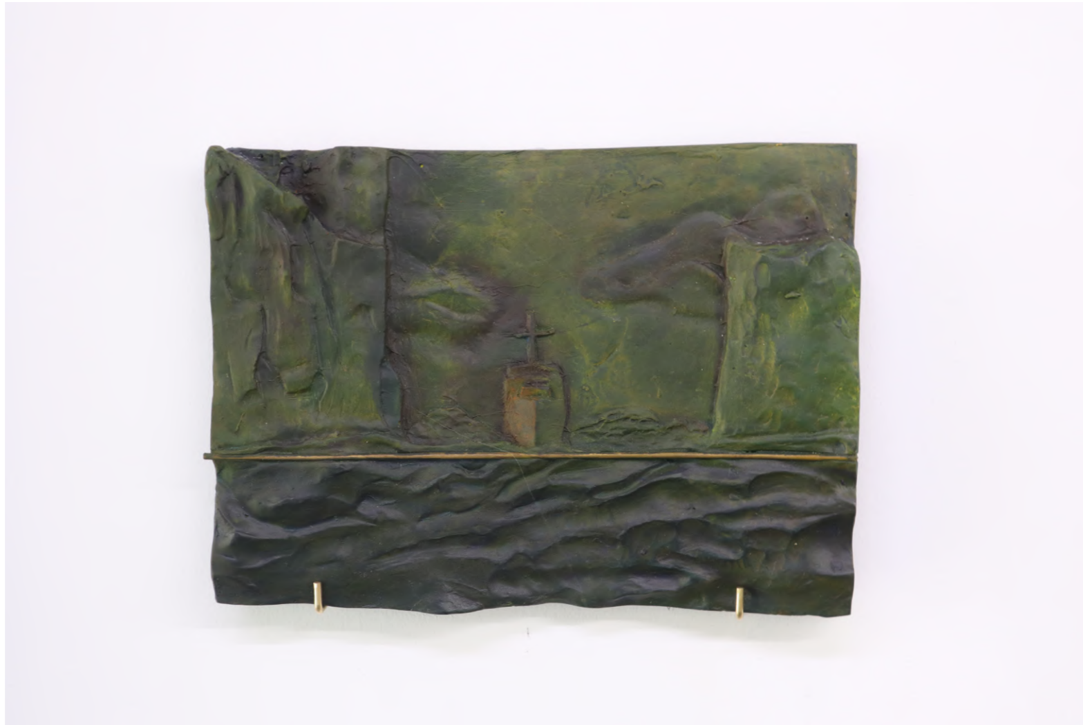
1ERA EXCURSIÓN | $1100 USD Placa de resina | 25 x 35 cm