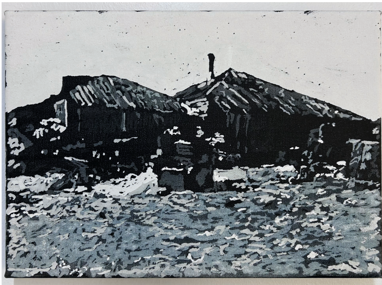
CAMPAMENTO | C/U $500 USD | CONJUNTO $1200 USD Acrílico sobre tela | 25 x 35 cm