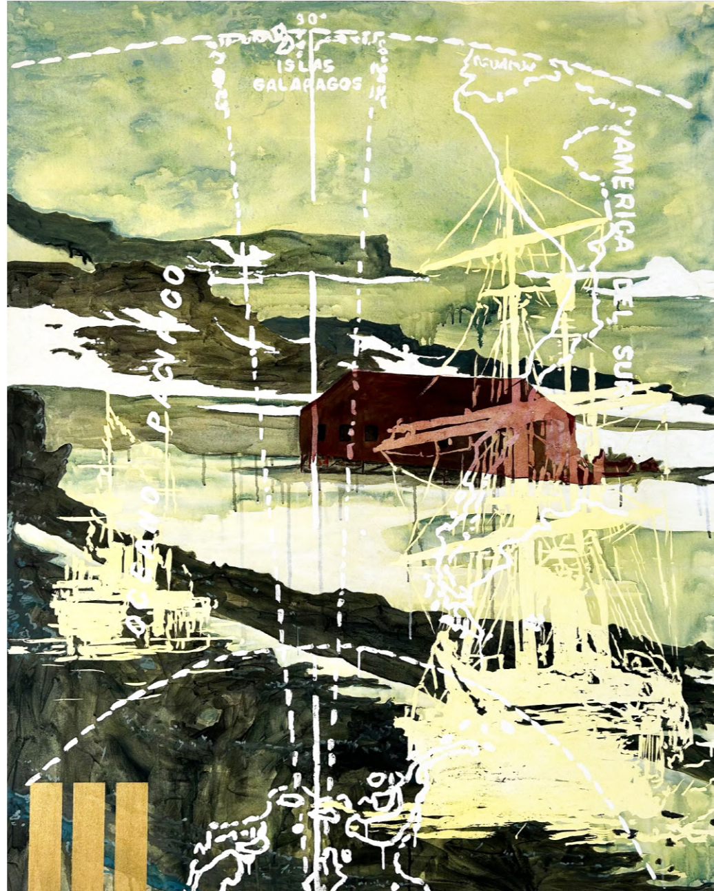
COORDENADAS | $2900 USD Acrílico sobre tela | 150 x 150 cm