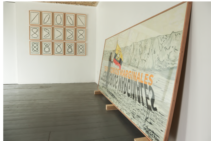
1984 | $4900 USD Acuarela | 120 x 240 cm