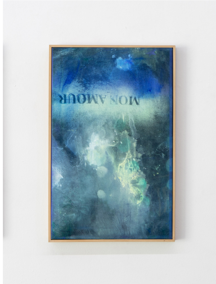
MALEZA II / $1.300.000 + IVA Medidas: 67 x 43 cm | Esmalte y óleo sobre lino