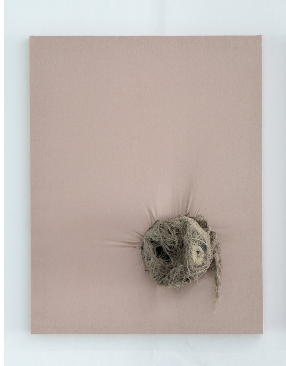
PELOTA / $1.700.000 + IVA Medidas: 70 x 90 cm | Pelota cosida sobre lino