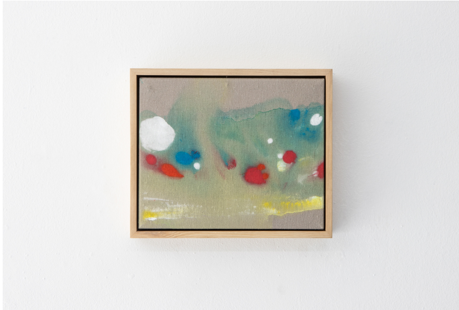
VISTA AL VALLE / $750.000 + IVA Medidas: 27 x 22 cm | Tempera sobre lino