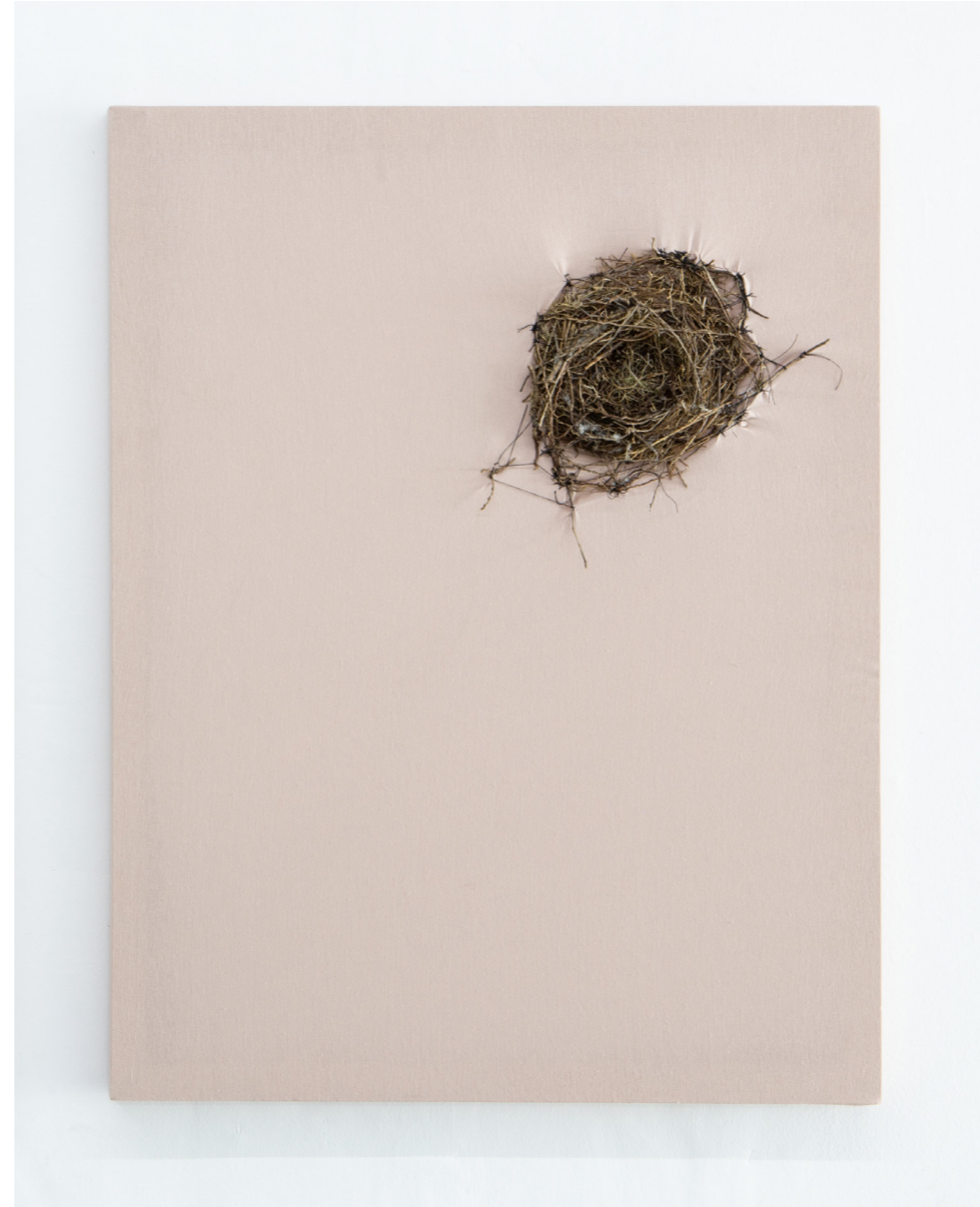
NIDO / $1.700.000 + IVA Medidas: 70 x 90 cm | Nido cosido sobre lino