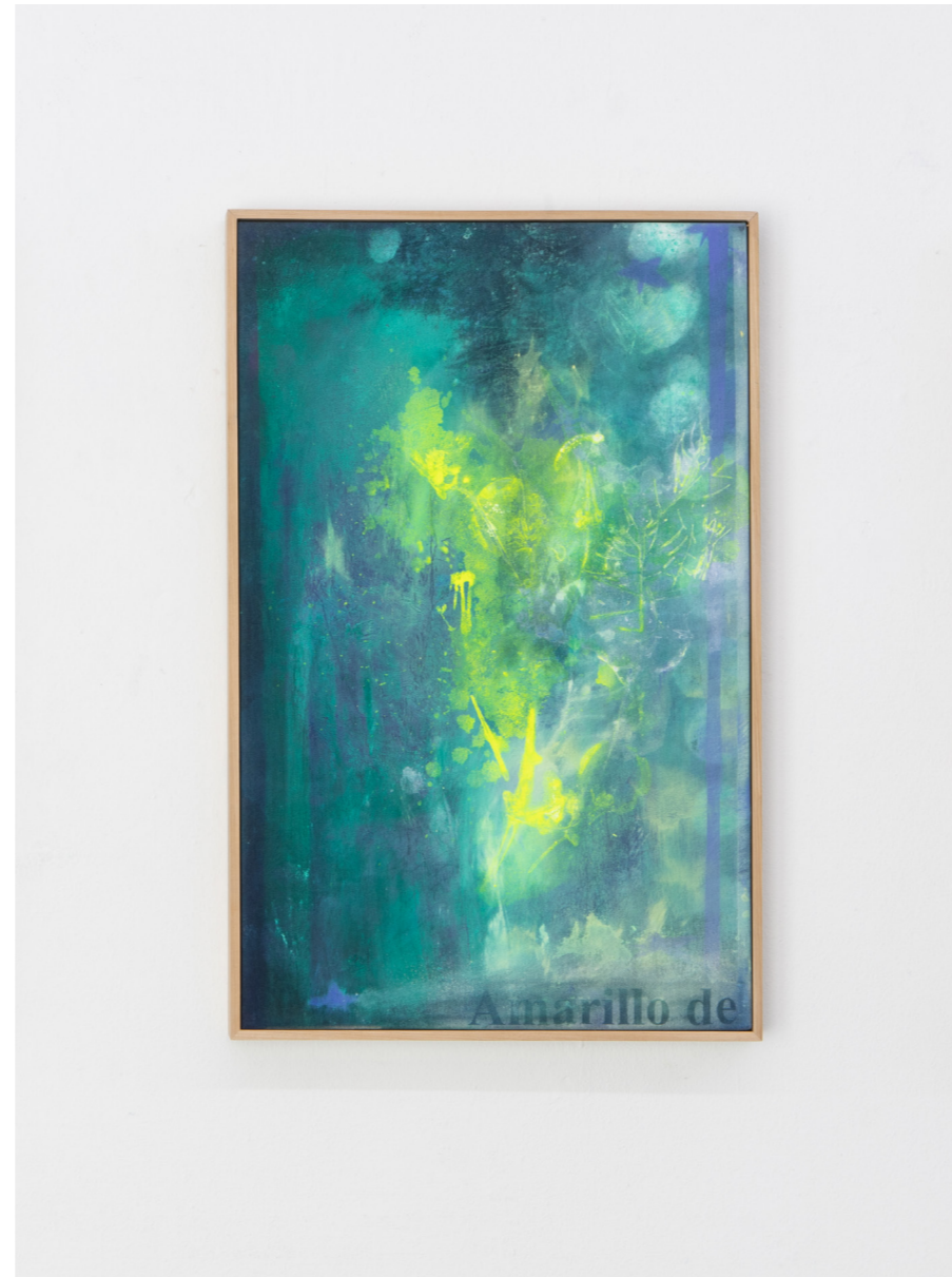
MALEZA VII / $1.300.000 + IVA Medidas: 67 x 43 cm | Esmalte y óleo sobre lino