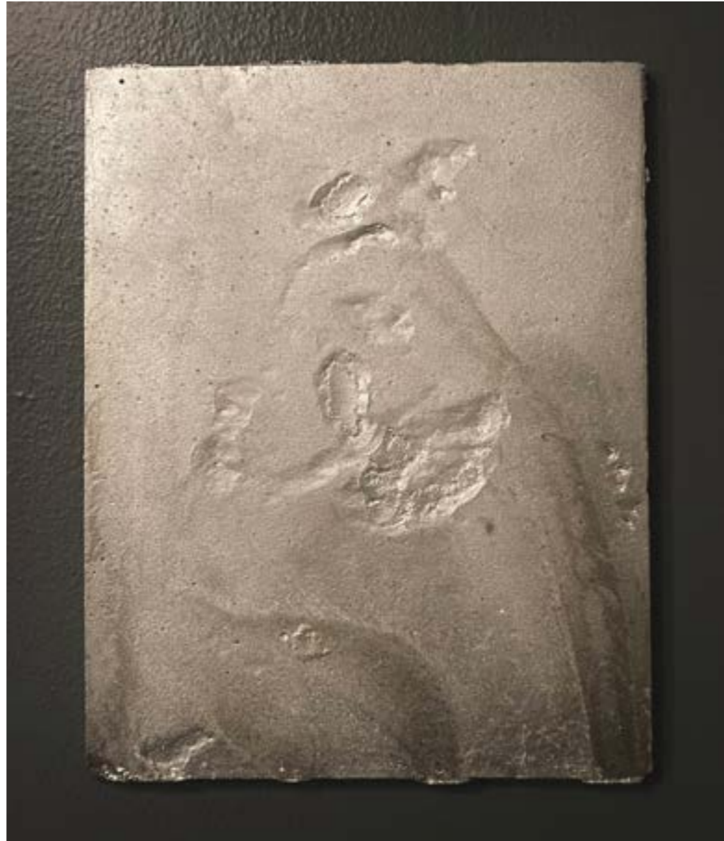
LA POSIBILIDAD DE UN ESPACIO / $350.000 + IVA Medidas: 27 x 21 x 1 cm | Aluminio fundido.