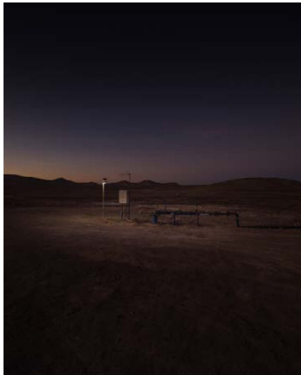
GOLDEN UNTITLED I (A ANTOFAGASTA) / $2.500.000 + IVA Medidas: 133 x 108 cm | Impresión Giclée, montado en Dibond y Acrílico.