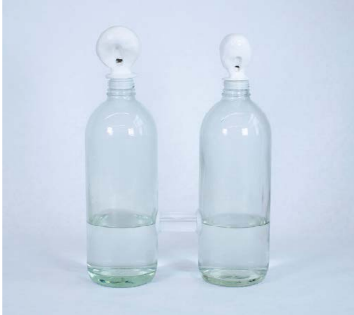
AGUA QUE LLORA - BOTELLAS SILVADORAS / $400.000 (C/U) Dimensiones variables | Botellas de vidrio, silbatos cerámicos y agua.