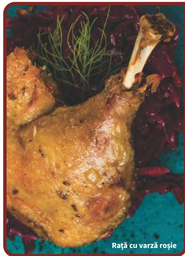
Rață cu varză roșie

CIOLAN AFUMAT (650g)3E, 108 Kcal / 451,44 KJ 64 ciolan cu os, produs afumat Alege pentru ciolan cea mai potrivită garnitură pentru tine: iahnie de fasole, mâncare de varză, cartofi prăjiți, cartofi brașoveni, etc. Garnitura este inclusă în preț. Pentru gramaje, ingrediente, alergenii și valori energetice vă rugăm consultați pagina "GARNITURI-SALATE".