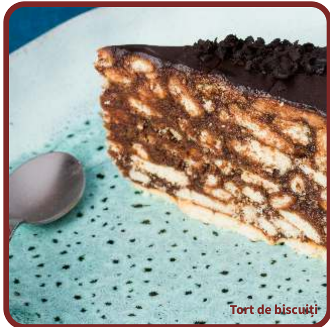
Tort de biscuiți

TORT DE BISCUIȚI (200g) 8E, 364,62 Kcal / 1524,11 KJ 30 biscuiți petit beurre, făină , lapte , unt , ouă , zahăr, pudră de cacao, ciocolată neagră Alergeni: soia, sulfiți, gluten, lapte, ouă