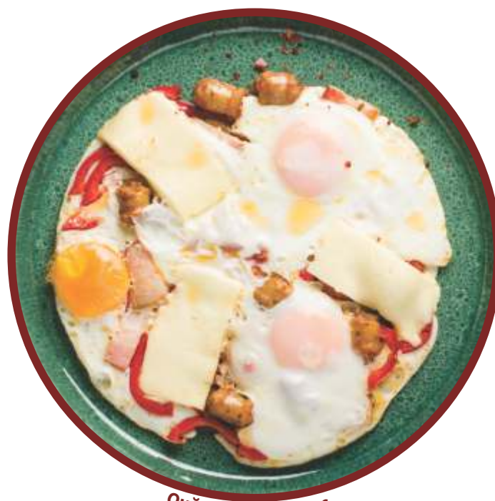
Ouă ochiuri la capac

Notă: micul dejun se servește până la ora 12.00