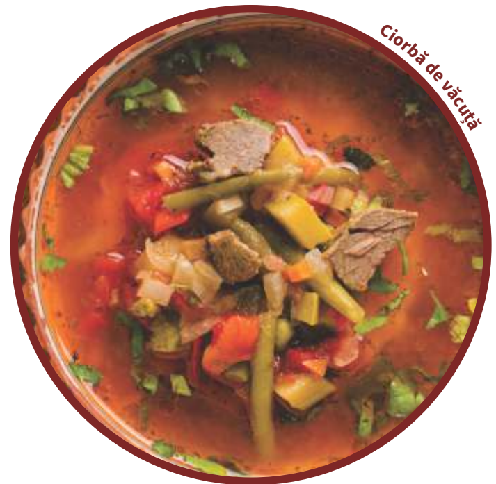
Ciorbă de vacuță

SUPĂ CREMĂ DE LEGUME (440g), 66,36 Kcal / 277,38 KJ 26 cartofi, morcovi, dovlecei, rădăcină de țelină , ardei gras, ceapă, ulei, sare. Alergeni: țelină CRUTOANE (50g), 293,58 Kcal / 1227,16 KJ pâine albă , ulei, sare, oregano, piper. Alergeni: gluten