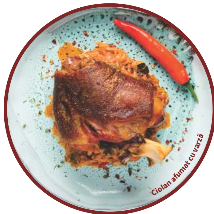
Ciolan afumat cu varză