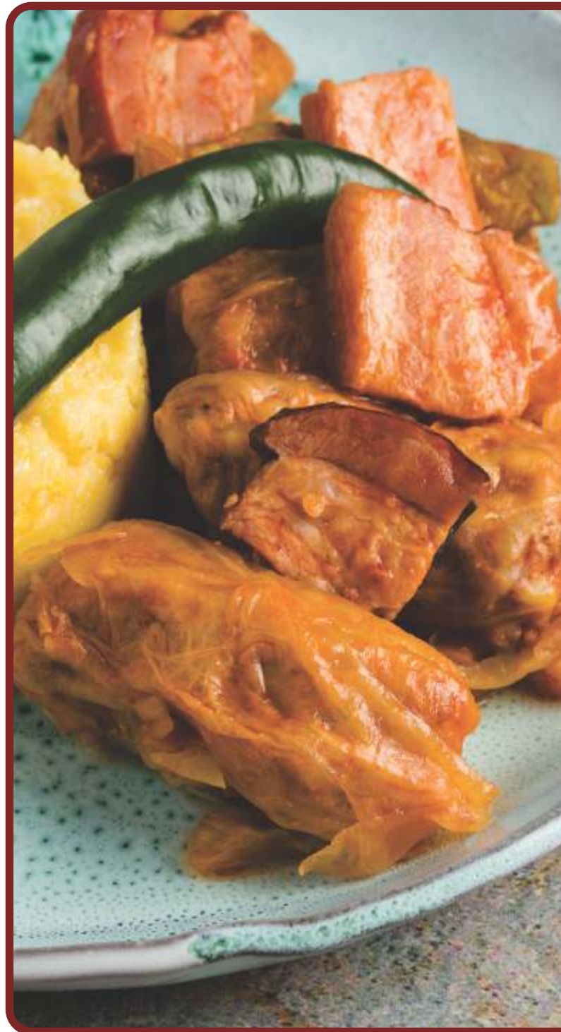
Sarmale cu varză și mămăliguță

(180g/300g), 212,58 Kcal / 888,6 Kj ceafă de porc la cuptor (ceafă de porc, ulei, vin roșu sec , usturoi, sare, piper, foi de dafin, cimbrușor), piure de cartofi (cartofi, lapte , unt , sos de ciuperci și trufe, sare) Alergeni: lapte, dioxid de sulf și sulfiți