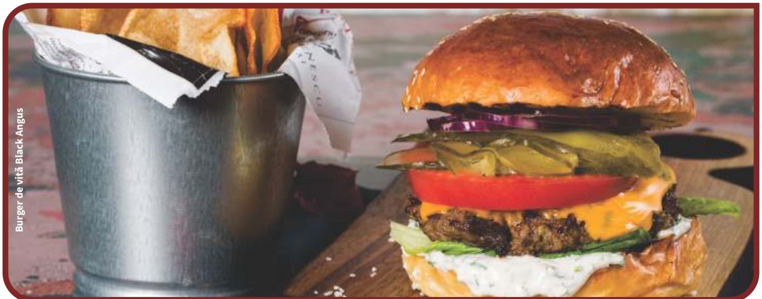
Burger de vită Black Angus

***Produsele din aceasta categorie vin însoțite de unul din următoarele sosuri, la alegere: Mujdei de usturoi, Sos de smântână cu hrean, Sos de smântână cu usturoi, Sos de maioneză, Sos calipso. Pentru ingrediente, alergenii și valori energetice va rugăm consultați pagina "EXTRA"