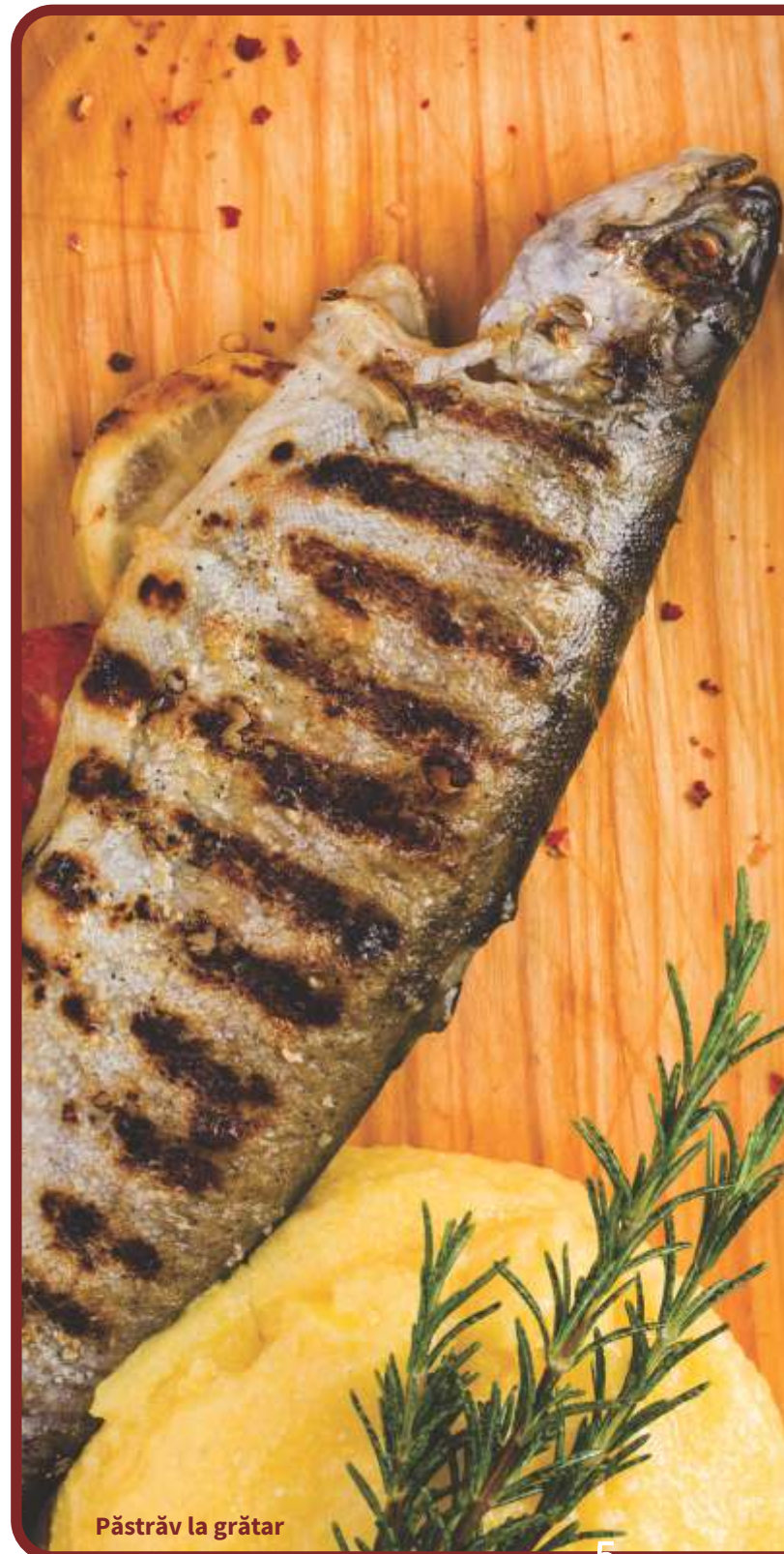
Păstrăv la grătar

Notă: produsele marcate cu * sunt disponibile în restaurantele LaMama Ateneu și LaMama Clubul Țăranului Român