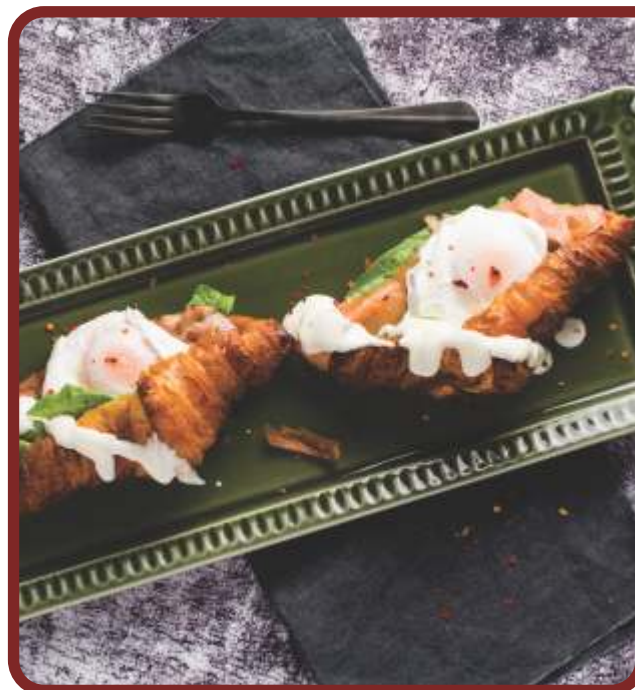
Ouă Benedict cu bacon și somon afumat