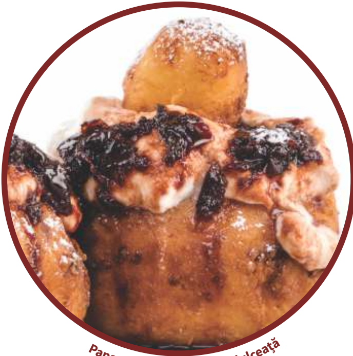
Papanashi cu smântână și dulceață