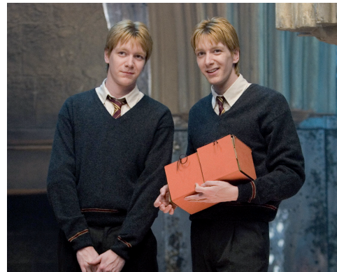
Fred i George Weasley