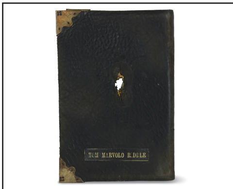
Diari del Tod Rodlel