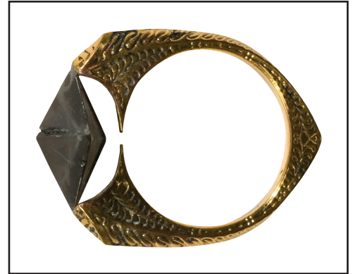
Pedra de la resurrecció