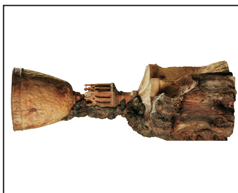
Calze de foc