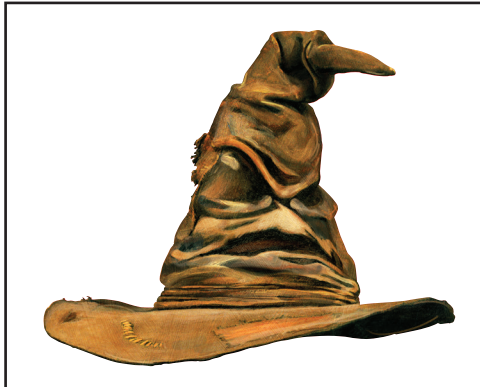
Barret que Tria