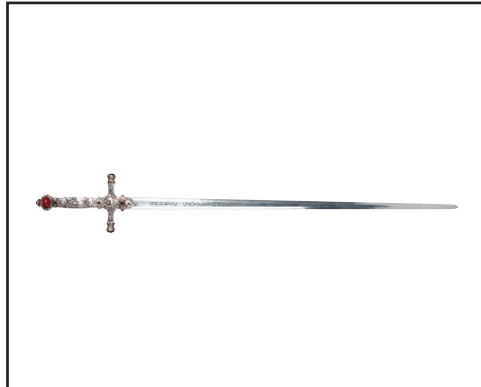
Espasa de Gryffindor