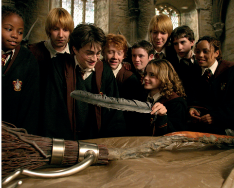
L'éclair de feu