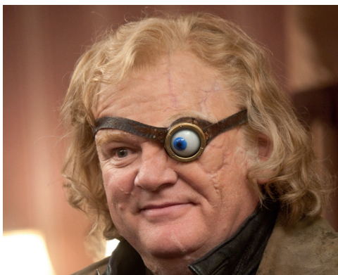
Maugrey Fol Œil