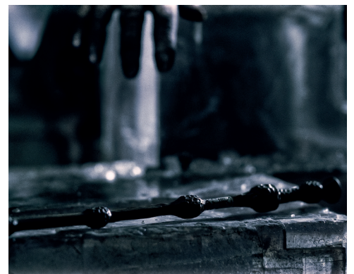
La baguette de sureau

Découpez les cartes et placez-les face retournée. Les joueurs prennent une carte et miment à leur équipe ce qu'il y a sur la carte (sans parler). Si l'équipe répond correctement, elle reçoit des points. Mais si l'équipe manque de fair-play, l'hôte peut lui enlever des points. Bonne chance !