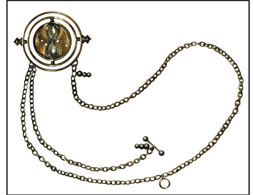
Le retourneur de temps