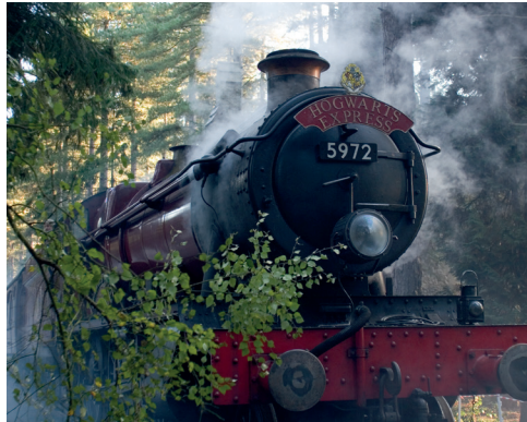
Le Poudlard Express