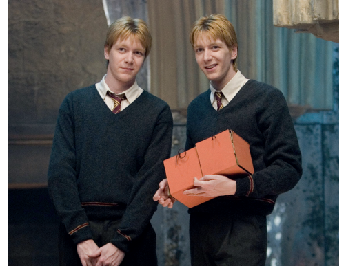
Fred & George Weasley