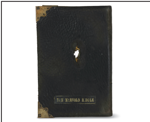
Le journal de Tom Jedusor