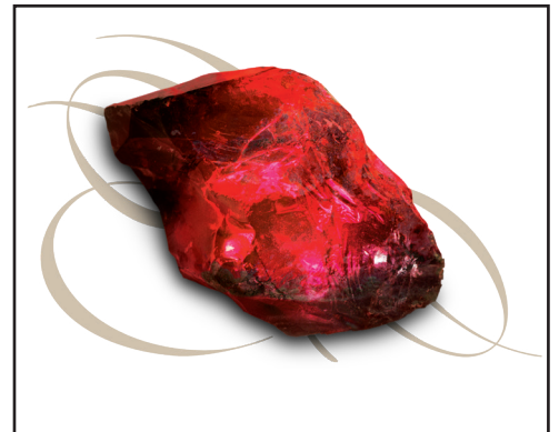
La pierre philosophale

Découpez les cartes et placez-les face retournée. Les joueurs prennent une carte et miment à leur équipe ce qu'il y a sur la carte (sans parler). Si l'équipe répond correctement, elle reçoit des points. Mais si l'équipe manque de fair-play, l'hôte peut lui enlever des points. Bonne chance !