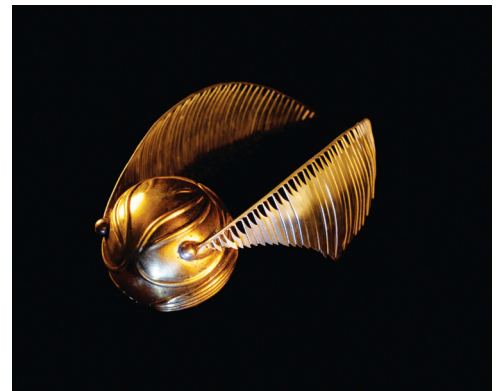
Le Vif d'Or