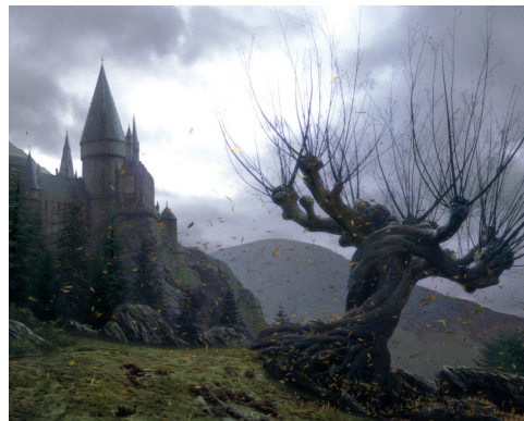
Le saule cogneur

Découpez les cartes et placez-les face retournée. Les joueurs prennent une carte et miment à leur équipe ce qu'il y a sur la carte (sans parler). Si l'équipe répond correctement, elle reçoit des points. Mais si l'équipe manque de fair-play, l'hôte peut lui enlever des points. Bonne chance !