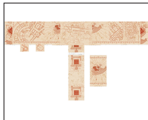
La carte du Maraudeur