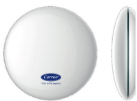
Módulo Wi Fi KSAIF0401AAA (*) (opcional)

Modulo Wi-Fi (USB), se adquiere por separado. Modelo con el símbolo (*) solo es compatible con la unidad de 18 y 24K.