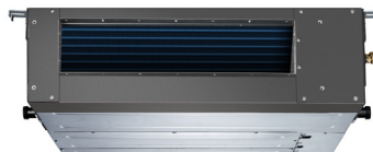
Fan & Coil