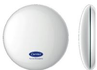
Módulo Wi Fi KSAIF0401AAA (*) (opcional)

Modulo Wi-Fi (USB) se adquiere por separado Modelo con el símbolo (*) solo es compatible con la unidad de 24K.