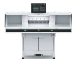
THE 56 avec portes / parois pour stand et tables latérales en option