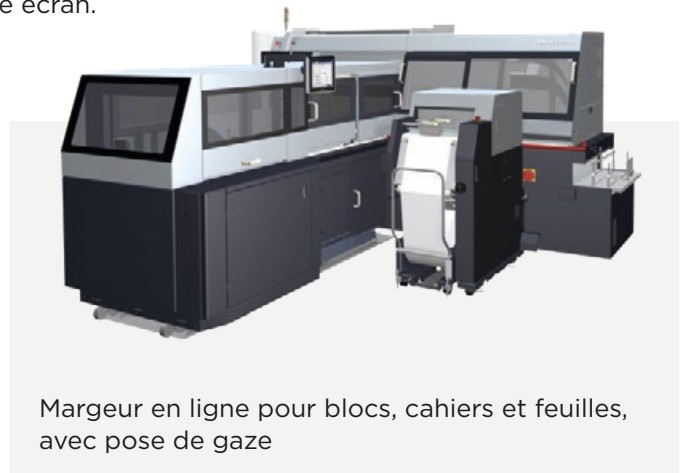
Margeur en ligne pour blocs, cahiers et feuilles, avec pose de gaze