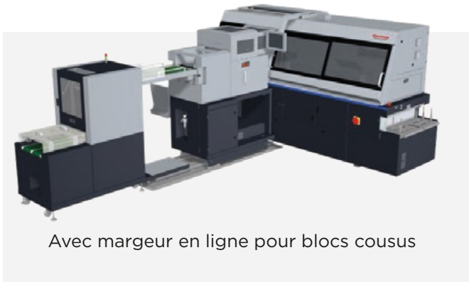
Avec margeur en ligne pour blocs cousus