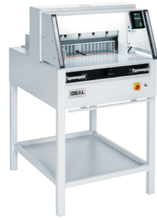
Model 4860 compacte office snijmachine