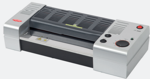
met hoezen Peak A3 model top model met 6 rollen