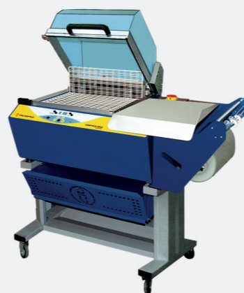
Om individuele boeken of pakken documenten en brochures onder beschermende film te verpakken