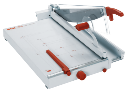
Tafelmodel IDEAL 1058