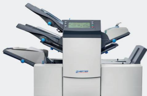
Vouwen van documenten en vullen van Amerikaanse en C5 omslagen met gevouwen documenten en bijsluiters tot 3000 st/uur