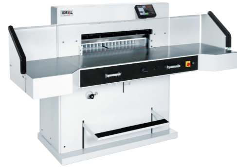
Model 7260 LT profi snijmachine 72cm snijbreedte met luchttafel