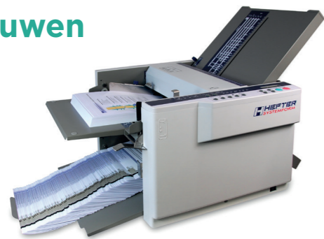
Tafelmodel vouwmachines Voor documenten tot A3+ met 2 vouwtassen en 5 verschillende vouw patronen