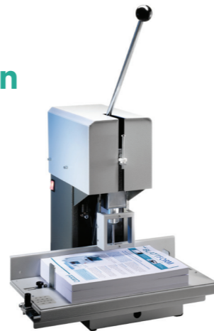
toestellen met 1, 2 of 4 boorkoppen