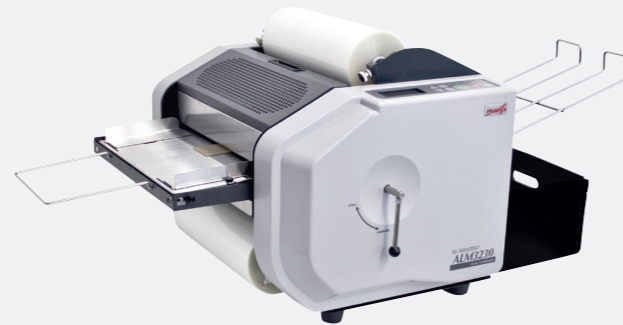
met rollen Fujipla Almeister 3230 voor volautomatisch 2-zijdig lamineren van A5 tot A3+ documenten