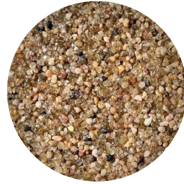
SIENA 1 LANÇAMENTO