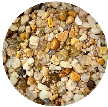
SIENA 2 LANÇAMENTO