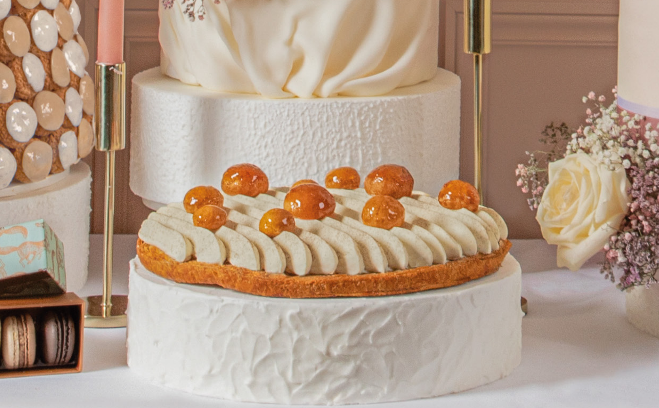
ENTREMETS SAINT HONORÉ TAILLE : 20CM - 15/16 PERSONNES