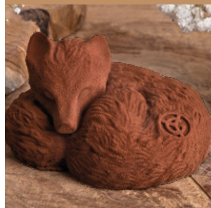
Renard en chocolat au lait fourré au praliné noisette.