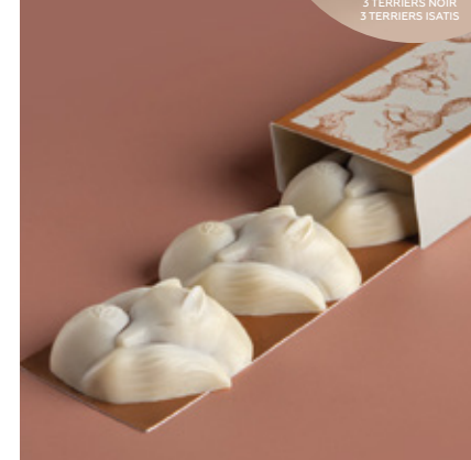
Bonbons au praliné noix de pécan enrobés au chocolat blanc.