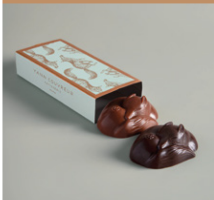
Bonbons au praliné enrobés au chocolat noir ou lait.