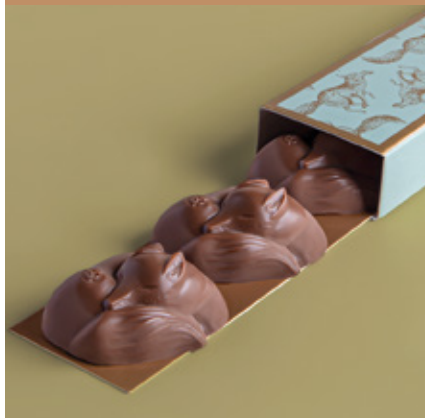
Bonbons au praliné à la pistache enrobés au chocolat au lait.