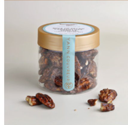
Noix de pécan torrifiées et caramélisées à la fleur de sel et à la vanille bleue de la Réunion.