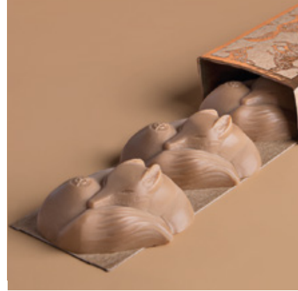
Bonbons au praliné enrobés au chocolat dulcey.