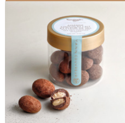
Amandes entières torrifiées et caramélisées enrobées de chocolat noir et poudrées de cacao.