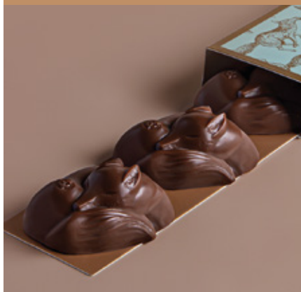
Bonbons au praliné enrobés au chocolat noir.