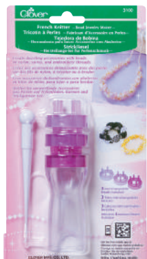
French Knitter Bead Jewelry Maker Art No. 3100 MSRP: $13.95