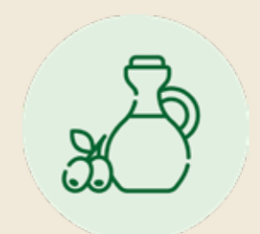
OLIO EXTRAVERGINE DI OLIVA