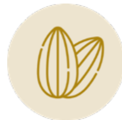
MANDORLE DI AVOLA