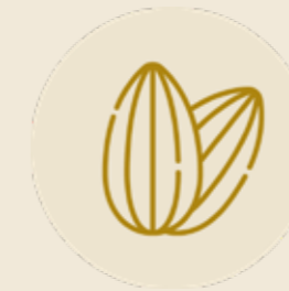
MANDORLE DI AVOLA