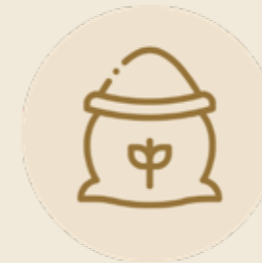
GRANI ANTICHI SICILIANI

EXCELLENT INGREDIENTS MADE IN SICILY WITH PATIENCE AND WISDOM EVERY DAY, WE SELECT THE BEST INGREDIENTS OUR LAND OFFERS