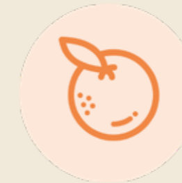
ARANCE E LIMONI DI SICILIA