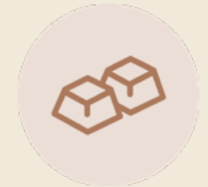
CIOCCOLATO DI MODICA IGP