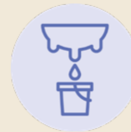
LATTE FRESCO SICILIANO